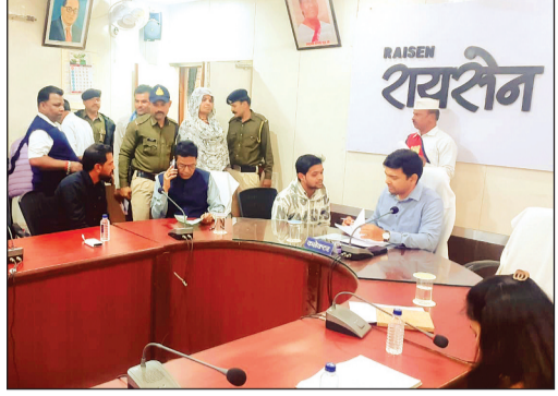
कनेक्शन काट दिया गया।