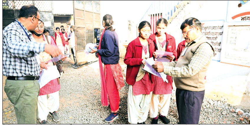
विदिशा। छात्राओं के प्रवेश पत्र की जांच कर उन्हें परीक्षा केंद्र तक पहुंचाते हुए ड्यूटी पर तैनात शिक्षक।