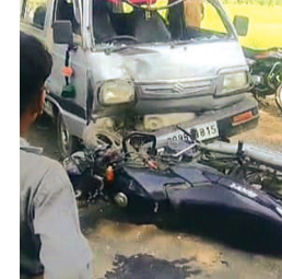
जिला चिकित्सालय रेफर कर दिया है। मिली जानकारी के अनुसार दोनों