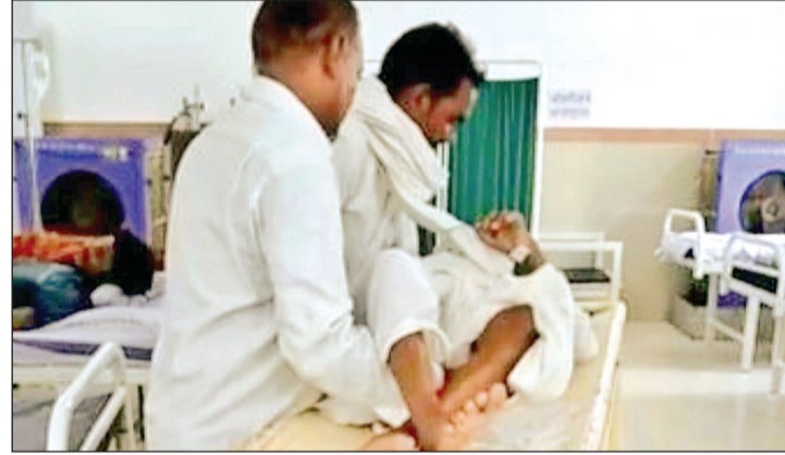
ले जाना पड़ता है।

मजबूरी में बुजुर्ग महिलाएं, बच्चे और परिजन खुद स्ट्रेचर धकेलते दिखाई देते हैं। कई बार तो व्हीलचेयर भी खाली पड़ी नहीं मिलती, जिससे मरीजों को गोद में उठाकर