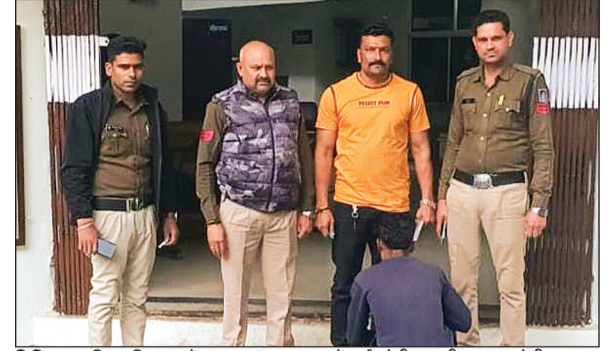
विदिशा। पुलिस गिरफ्त में आया शंकर नगर में हुई चोरी का तीसरा आरोपी।